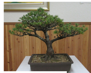
～2025年始業式～ 縁起物の松盆栽

昨年の当社活動第一目標としては「品質向上」を掲げ、第一工場単品加工は、加工不良率が〇・六%よりマイナスし〇・二%でした。これは月五〇〇個の部品に対し不良が一個の数字です。また、第二工場量産加工は、OM様より十一月まで十八ヶ月連続Aランク評価の結果です。大変素晴らしいことであり、皆さんの品質に対する日々の意識・努力の成果であります。ご協力をいただいた本当にありがとうございます。今年も会社方針・社訓・カレンダー訓を是非とも充分理解していただき『明るい・楽しい・おもしろい』ものづくり集団を目指してよろしくお願いたします。