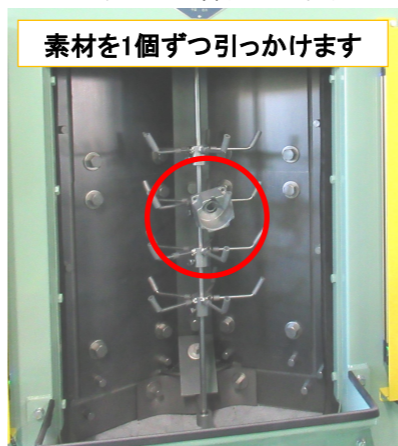
素材を1個ずつ引っかけます

昨年塗装グループは大幅なレイアウト変更と、この研掃機が導入されたことにより作業効率が大幅に向上されました。これからもお客様に確かな品質の製品を提供していきます。