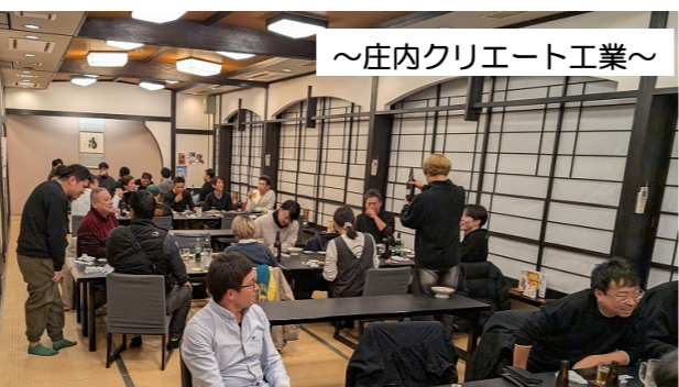
～庄内クリエート工業～