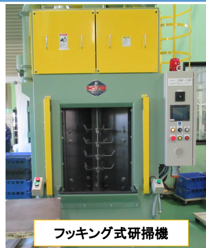
フッキング式研掃機

令和六年十一月に新たにフッキング式の研掃機が導入されました。研掃機は塗装を付きやすくする為の前処理工程で、アルミダイカスト加工素材の汚れを取ってきれいにします。フッキング式の研掃機は一度に多くの数を仕上げることは出来ませんが、素材同士がぶつかり合っていたキズやバリ等は発生しない為、これまでのバレル式で行っていた研掃後の修正作業時間がなくなります。素材が大きいものはフッキング式へ、小さいものはバレル式にと種類分けをして立ち上げ作業を行い、本格的に生産を進めています。